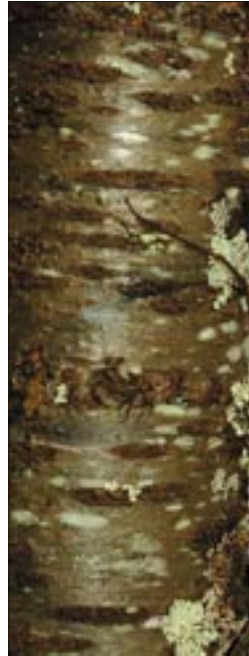
Merisier Prunus avium